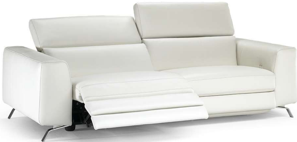
■ Vers. 446