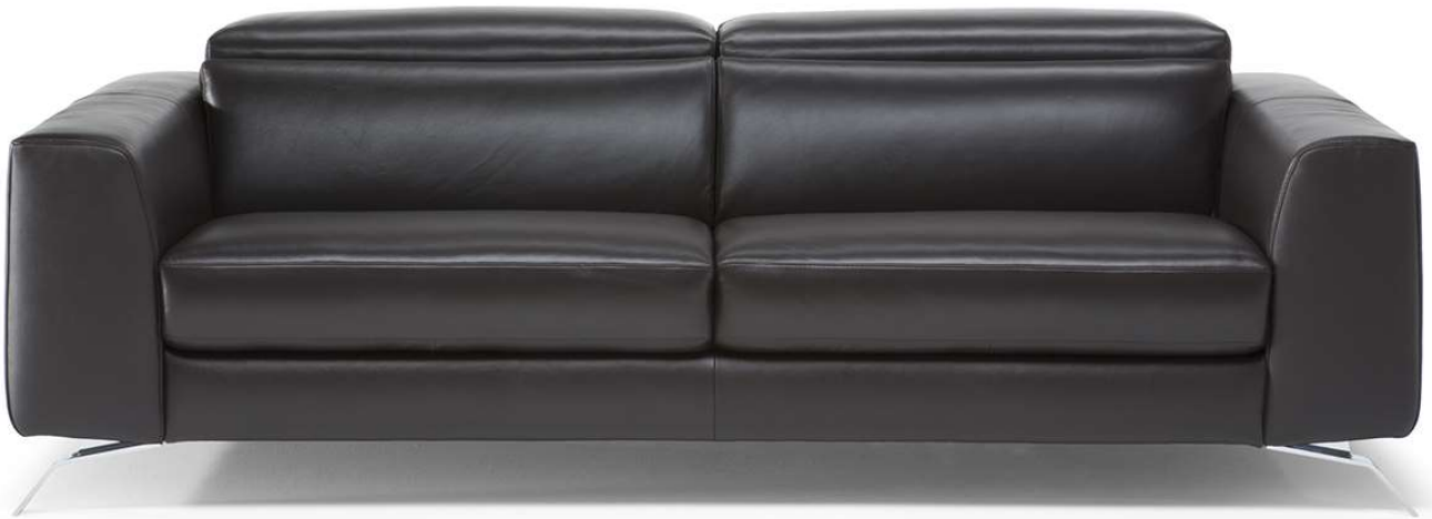
■ Vers. 009