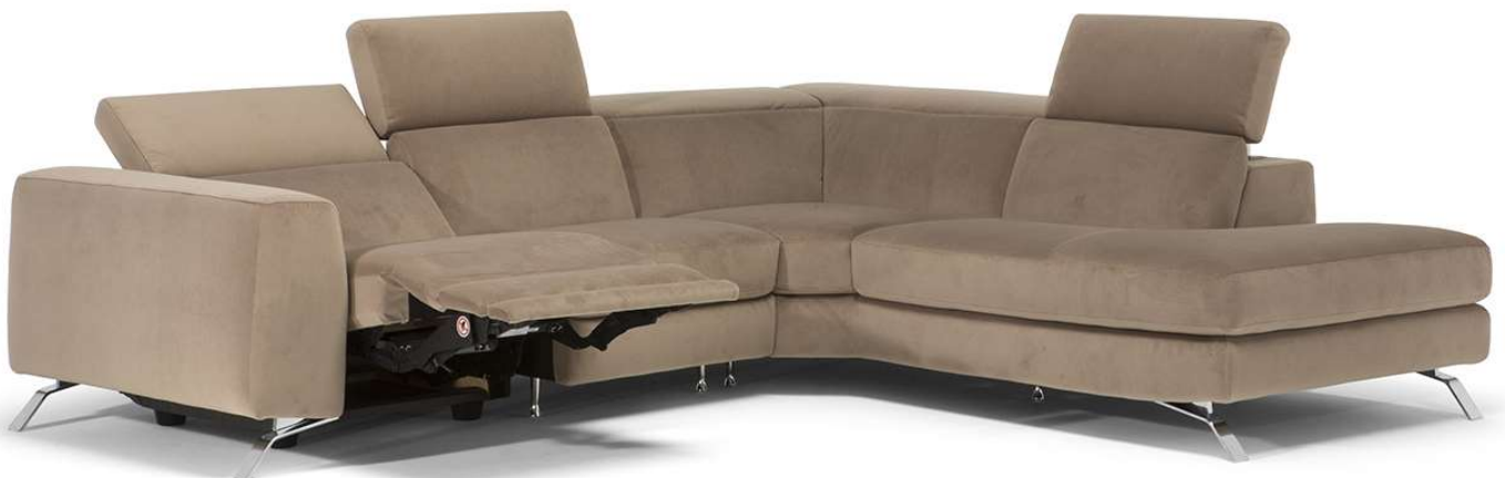
■ Vers. 182+201