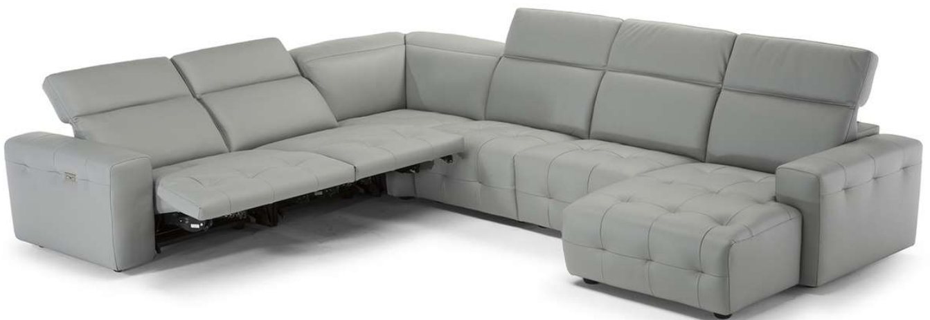
■ Vers. 450+338+291+011+291+049