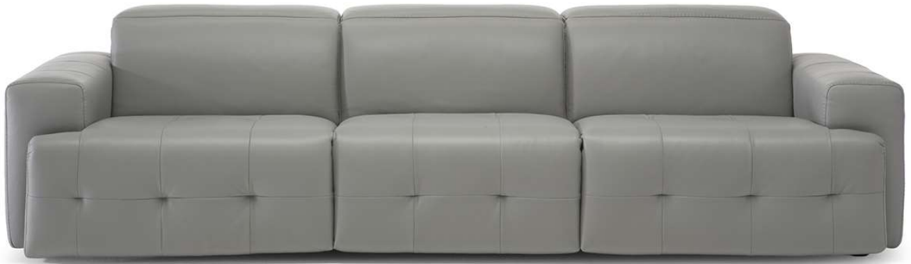
■ Vers. 450+338+452