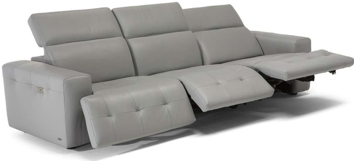
■ Vers. 450+338+452