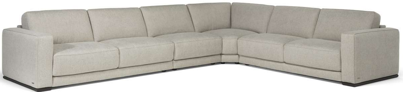
■ Vers. 216+291+011+217