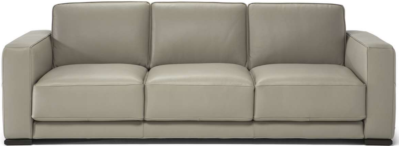
■ Vers. 064