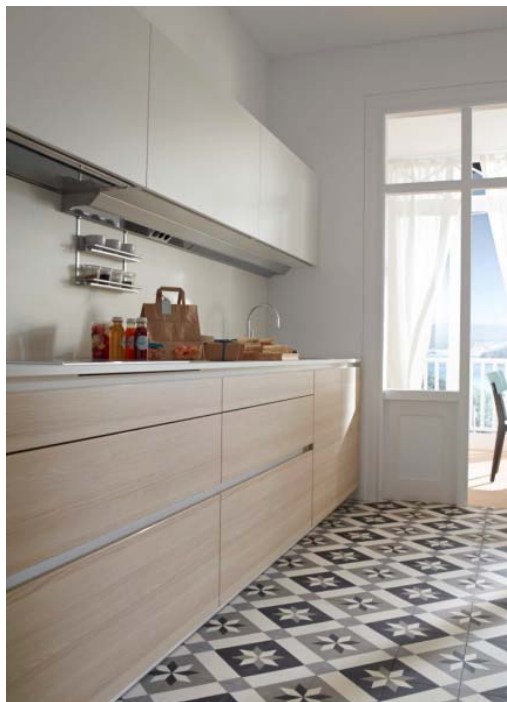
Código imagen: 0321560G01D2013