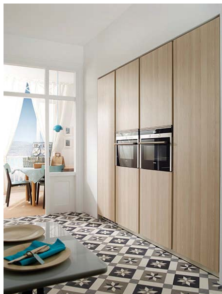
Código imagen: 0321560G02D2013