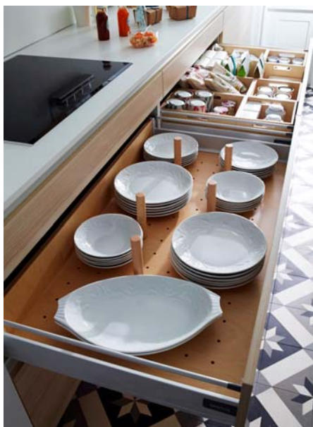
Código imagen: 0321560110D2013