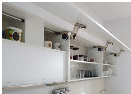
Código imagen: 0321560I04D2013