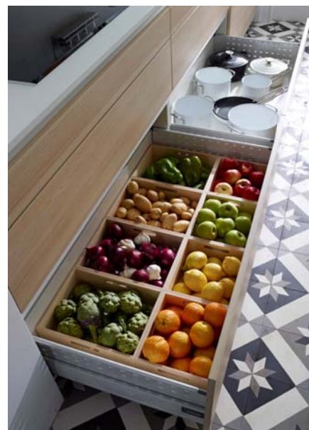
Código imagen: 0321560111D2013