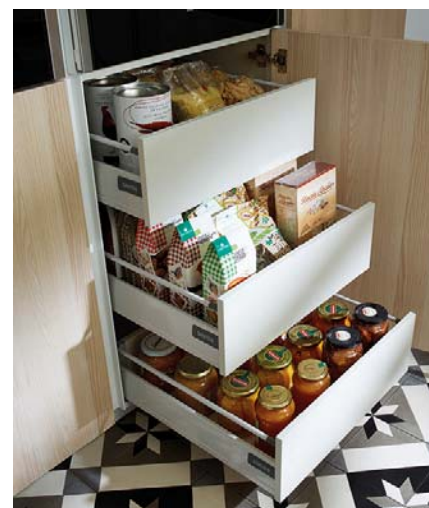
Código imagen: 0321560I06D2013