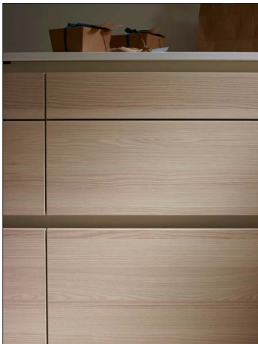
Código imagen: 0321560F00D2013