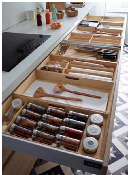
Código imagen: 0321560109D2013