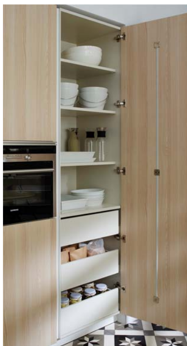
Código imagen: 0321560I05D2013