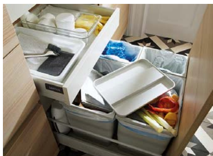
Código imagen: 0321560I08D2013